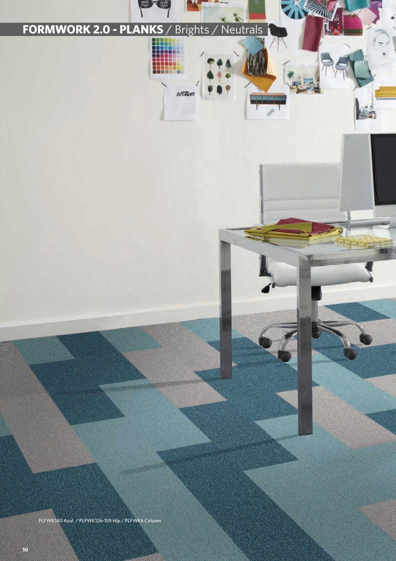
PLFWK140 Azul / PLFWK126-159 Hip / PLFWK6 Column