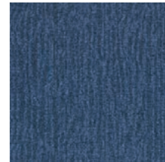
SFT CL 73 Cadet Blue SFT FP 73 Cadet Blue (24) (10)