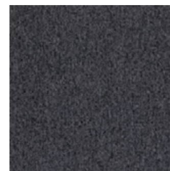
LVL CL 27 Charred LVL FP 27 Charred