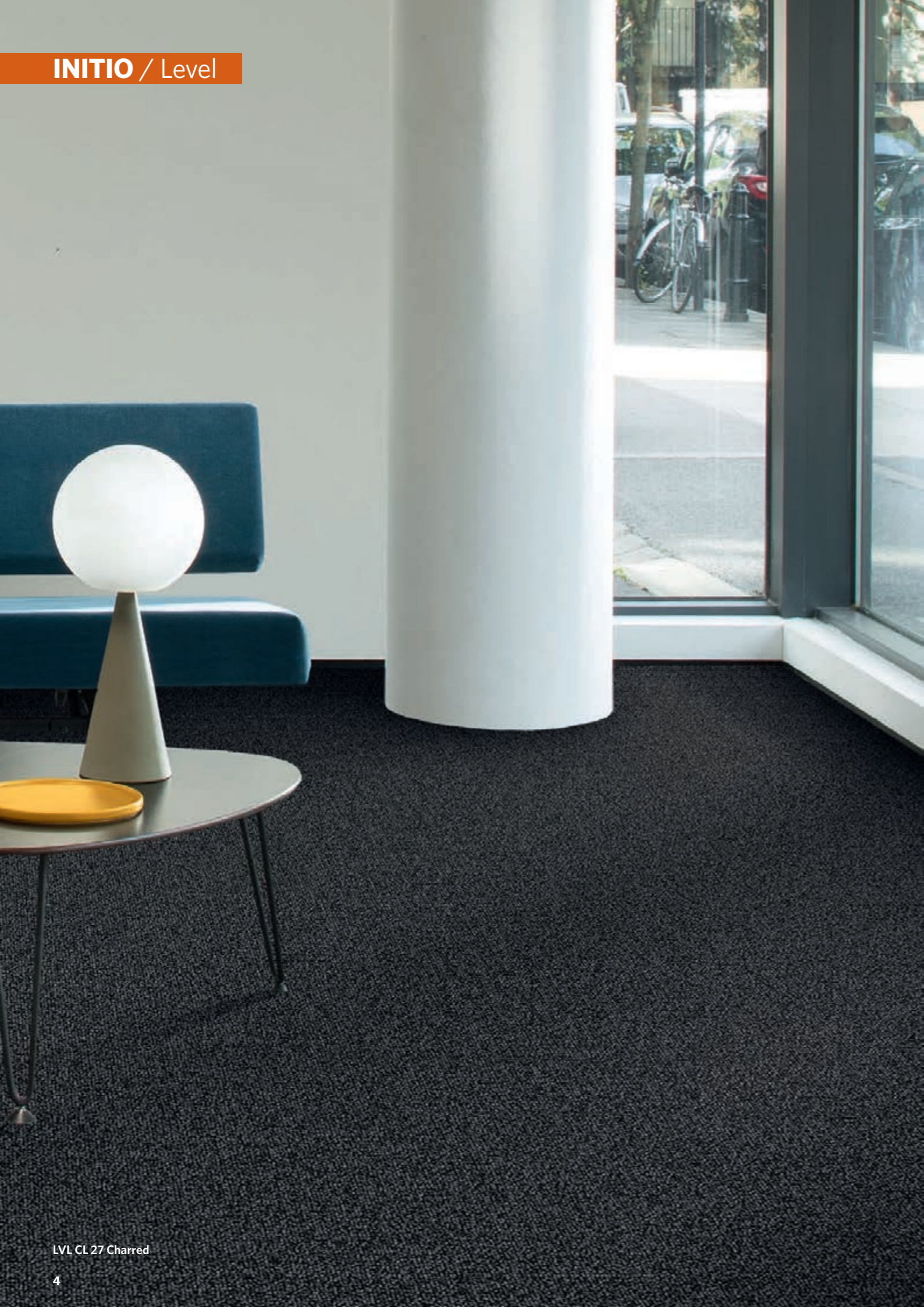
LVL CL 27 Charred