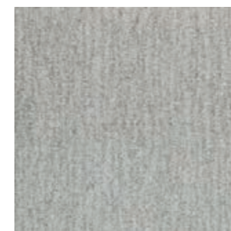
SFT CL 144-152 Cotton SFT FP 144-152 Cotton (24) (10)