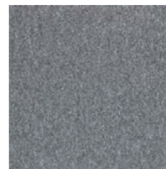
LVL CL 153 Dove LVL FP 153 Dove