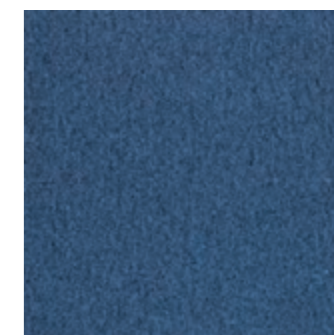
LVL CL 170 Waves LVL FP 170 Waves