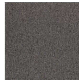
LVL CL 120 Brownstone LVL FP 120 Brownstone