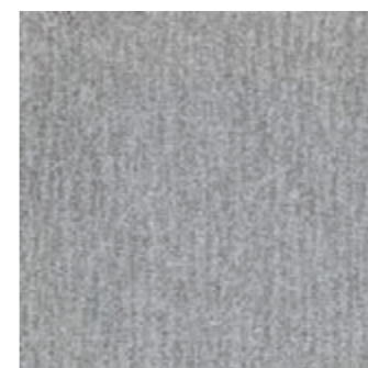
SFT CL 153 Rocksalt SFT FP 153 Rocksalt (24) (10)