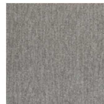
SFT CL 152-108 Pumice SFT FP 152-108 Pumice (24) (10)