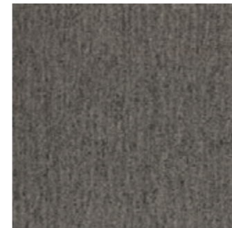
SFT CL 108-120 Gunsmoke SFT FP 108-120 Gunsmoke (24) (10)