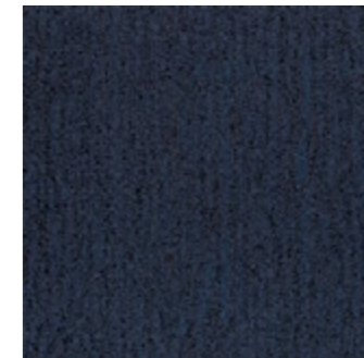
SFT CL 27-19 Urban Sky SFT FP 27-19 Urban Sky (24) (10)