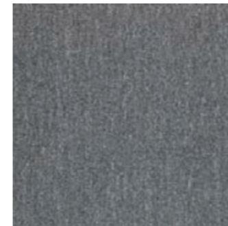
SFT CL 106 Slate Grey SFT FP 106 Slate Grey (24) (10)