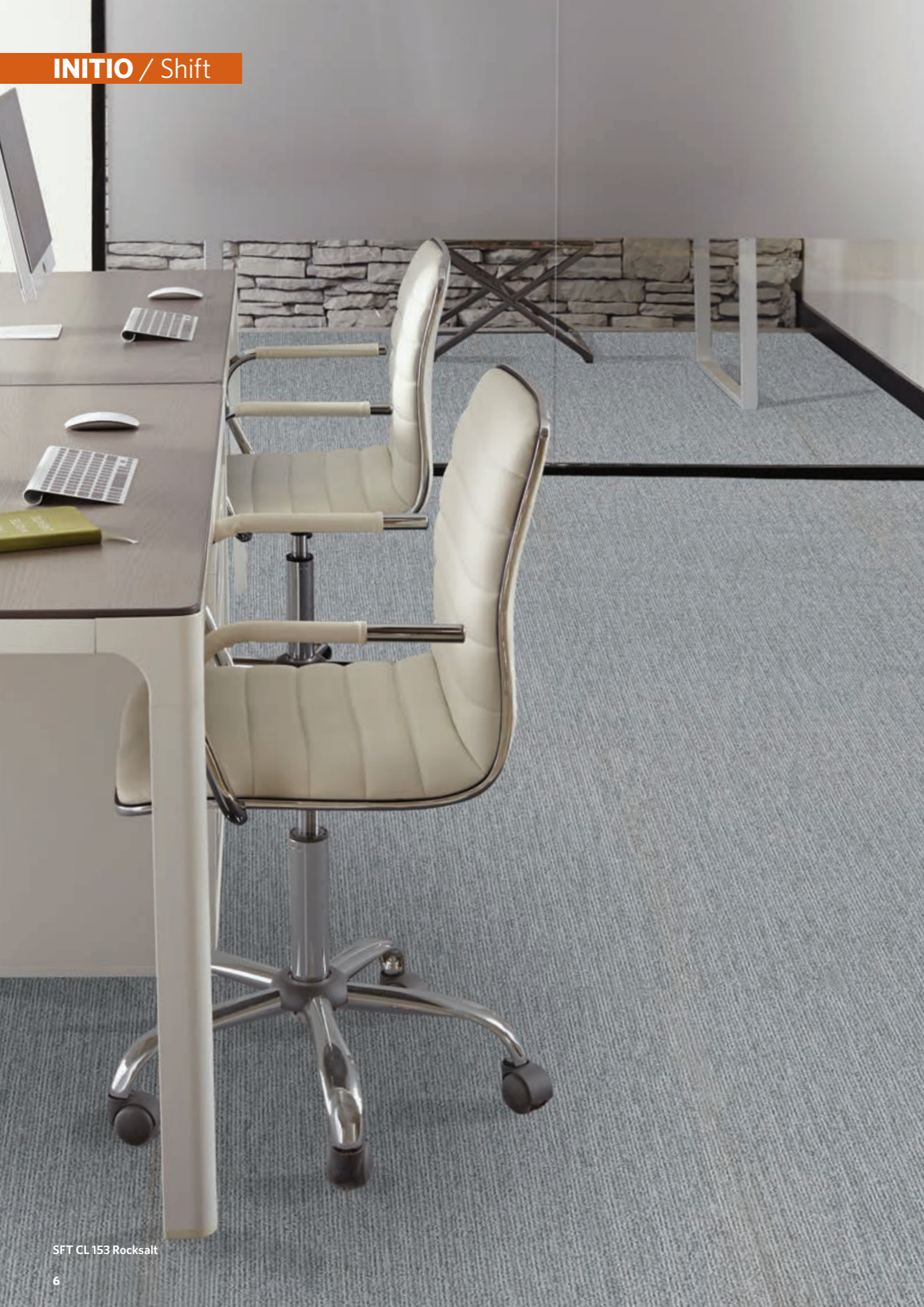
SFT CL 153 Rocksalt